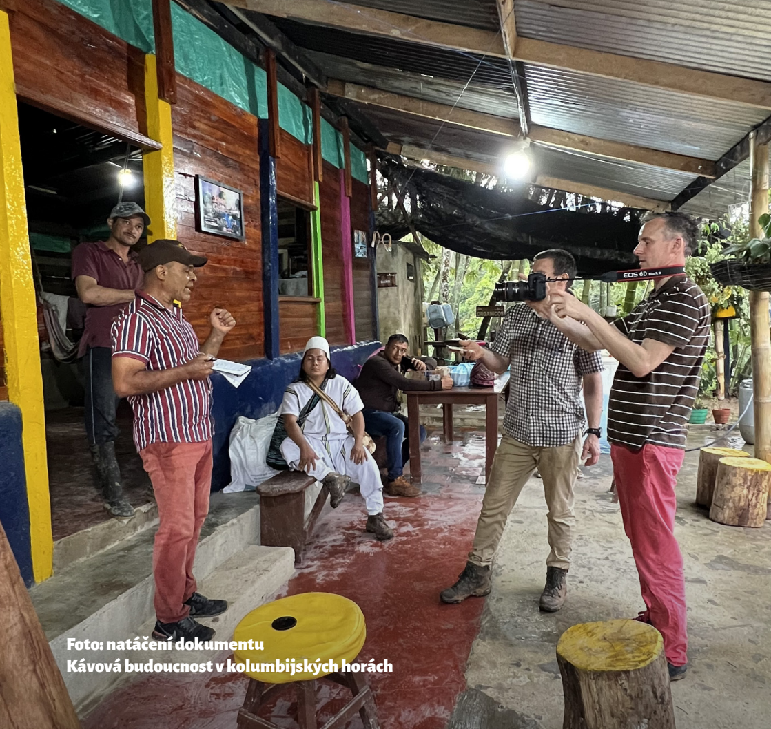
Foto: natáčení dokumentu Kávová budoucnost v kolumbijských horách