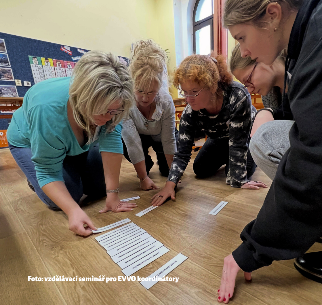
Foto: vzdělávací seminář pro EVVO koordinátory