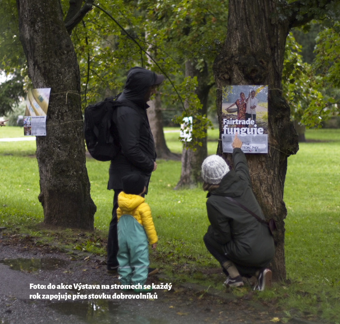
Foto: do akce Výstava na stromech se každý rok zapojuje přes stovku dobrovolníků