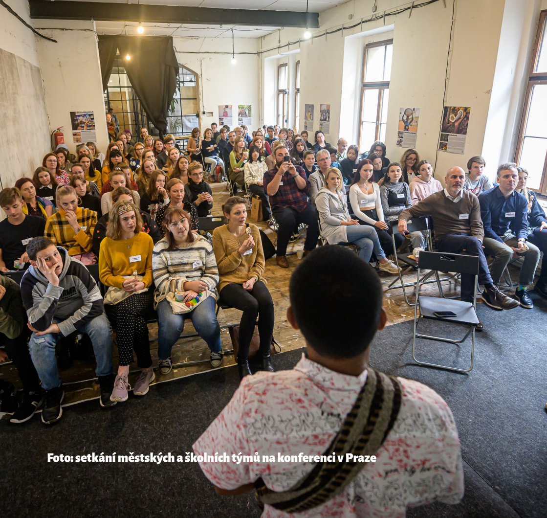
Foto: setkání městských a školních týmů na konferenci v Praze