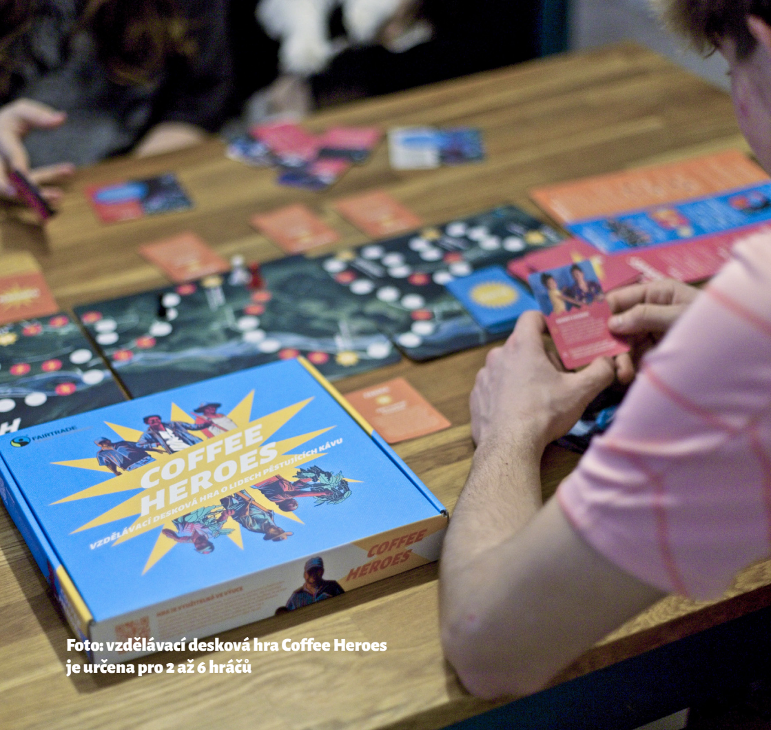
Foto: vzdělávací desková hra Coffee Heroes je určena pro 2 až 6 hráčů