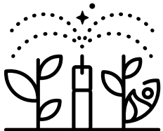
Ekologické pěstování květin