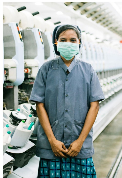
Pracovnice Armstrong Group, textilní továrny v Tamil Nadu v Indii.

Pěstování bavlny je náročné na spotřebu vody. Na výrobu jednoho trička je zapotřebí 2700 litrů vody, což je množství tekutin pro jednoho člověka zhruba na 900 dnů.