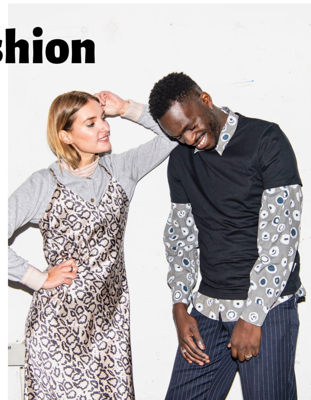
Záběry z kampaně Fashion Revolution

Máme ale i víc než jen spotřební roli. Svět ovlivňujeme také jako aktivní občané. Stále více lidí se zajímá a je pro ně důležitá změna fungování textilního průmyslu. Zapojit se můžeme do kampaní, jako je například Fashion Revolution, a podpořit transparentnost dodavatelského řetězce.