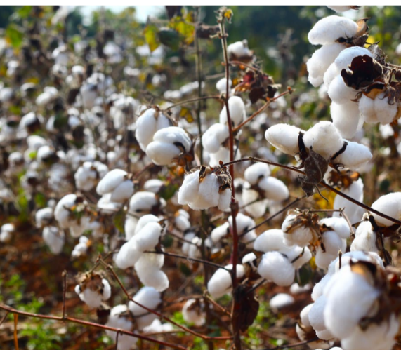
Na jedné rostlině bavlníku obvykle vyroste 10 až 30 tobolek.

Při posuzování etičnosti výrobku se nemůžeme spokojit pouze s udržitelným materiálem, tedy bio nebo fairtradovou bavlnou. Výroba našeho trička totiž dále pokračuje výrobou v textilních nebo oděvních továrnách. Tam může hrozit, že na tričku pracovaly děti nebo byly za otrockou mzdu zneužívány mladé dívky. Lepší podmínky výroby oblečení si můžeme kromě lokální produkce zajistit tím, že si ověříme členství výrobce například ve Fair Wear Foundation ( www.fairwear.org ) či Světové fairtradové organizaci ( www.wfto.com ).